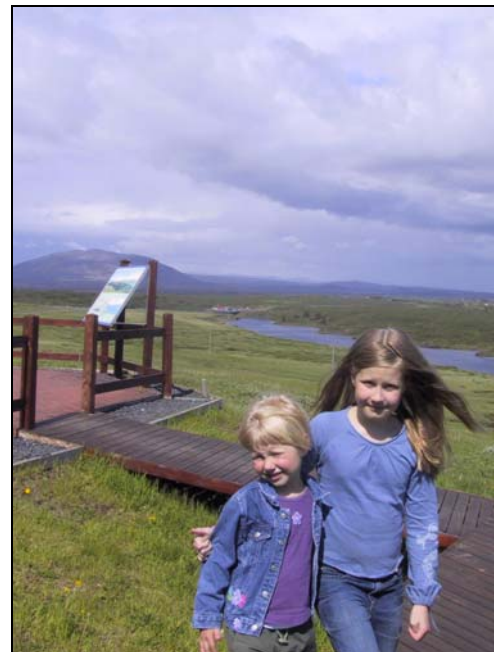
Við áningarstað undir Ingólfsfjalli.

Spurt var hvað fólk teldi mikilvægast að gera varðandi samgöngur á hálendinu. Margir vildu láta lagfæra hálendisvegi að vissu marki og nokkuð margir vildu verulegar vegabætur. Um 12%