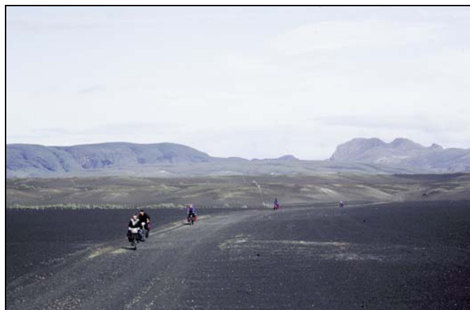
Hjólreiðamenn á Landmannaleið

Nær þrír af hverjum fjórum í höfðu einhvern tímann farið einn eða fleiri af eftirtöldum fjallvegum: Kjalveg, Sprengisandsveg, Kaldadalsveg eða Fjallabaksleið nyrðri. Höfðu 60% farið yfir Kjöl, nær helmingur yfir Sprengisand og Kaldadal og rúmlega þriðjungur hafði einhvern tímann farið um Fjallabaksleið nyrðri. Er í öllum tilvikum um talsverða aukningu að ræða frá könnu RRF árið 2002.